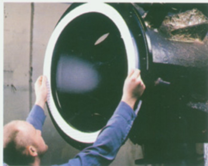
GORE-TEX GR® R 膨体四氟硬质板状垫片的应用